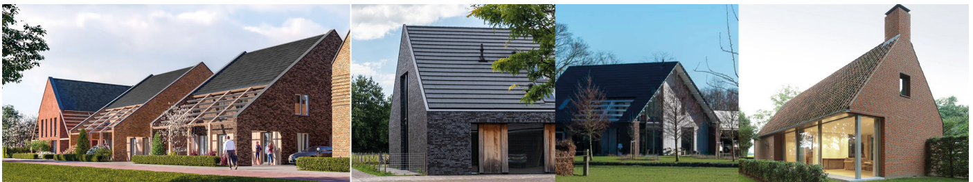
Een afwisselend beeld aan de landschapszijde met flinke kappen en eenvoudige bouwvolumes