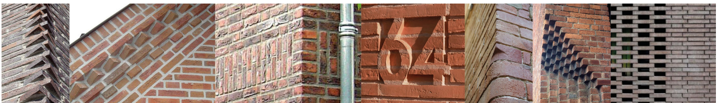
Verbijzondering door sterke detaillering