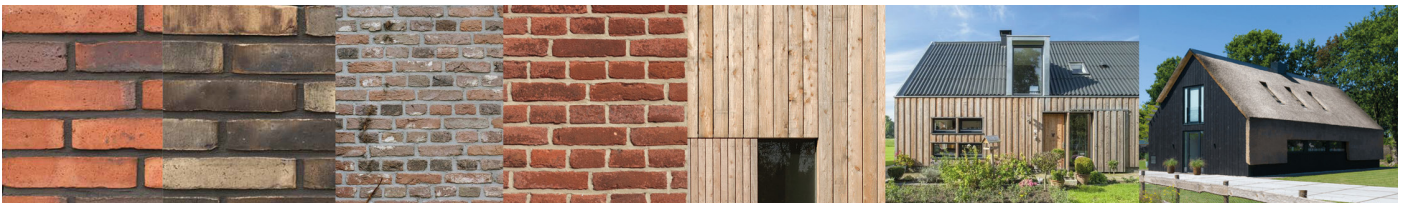
Natuurlijke materialen, metselwerk afgewisseld met houten delen (rood, bruin, grijsig, mix ook mogelijkheid)