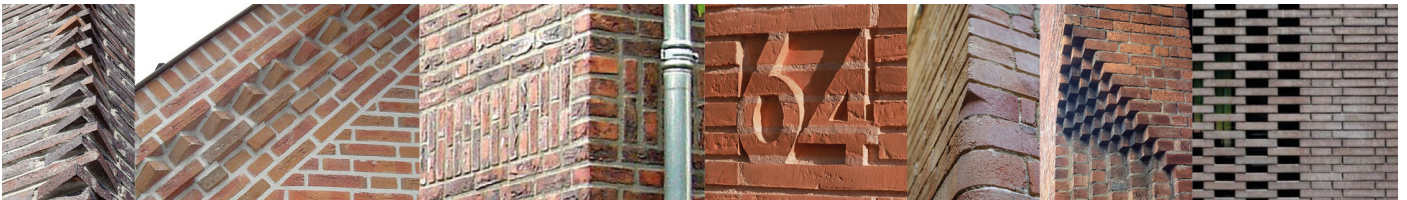
Verbijzondering door sterke detaillering