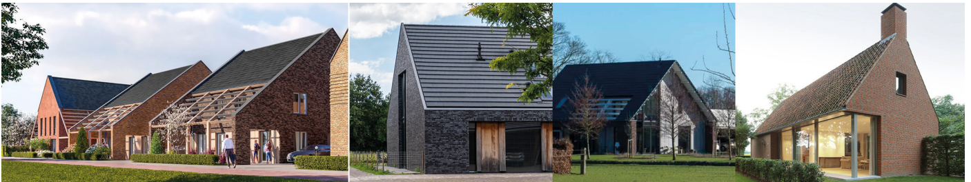
Een afwisselend beeld aan de landschapszijde met flinke kappen en eenvoudige bouwvolumes