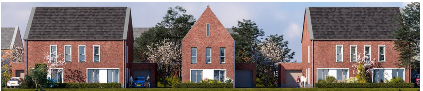
Deze woningen worden gerealiseerd in uw straat. U dient hierop aan te sluiten