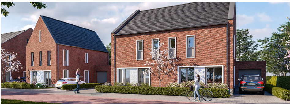
Deze woningen worden gerealiseerd in uw straat. U dient hierop aan te sluiten

De architectuur van de vrijstaande woning is net als de andere bebouwing landelijk en stoer met een grote kap en eenvoudig bouwvolume. Het materiaal voor de gevels is baksteen. Het dak wordt uitgevoerd in een donkere dakbedekking. Dit inspiratieblad laat diverse mogelijkheden zien voor een vrijstaande woning op dit kavel. Laat u inspireren door de woningen die al in de straat gebouwd zijn.