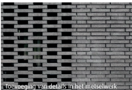
Toevoeging van details in het metselwerk