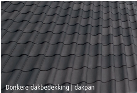
Donkere dakbedekking | dakpan

Het inspiratieblad laat een aantal mogelijkheden zien voor de erf-entrewoning.