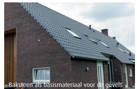
Baksteen als basismateriaal voor de gevels