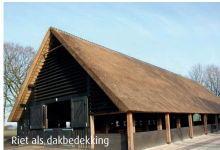
Riet als dakbedekking