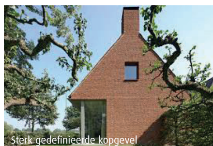
Sterk gedefinieerde kopgevel