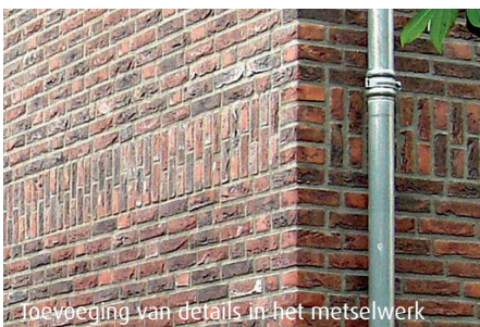
Toevoeging van details in het metselwerk