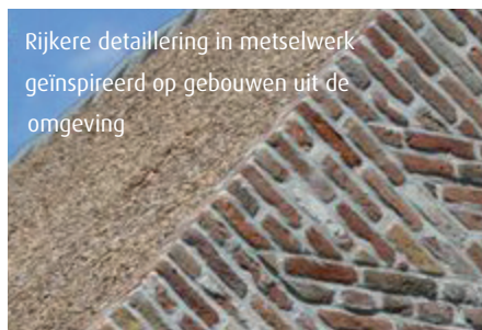
Rijkere detaillering in metselwerk geïnspireerd op gebouwen uit de omgeving