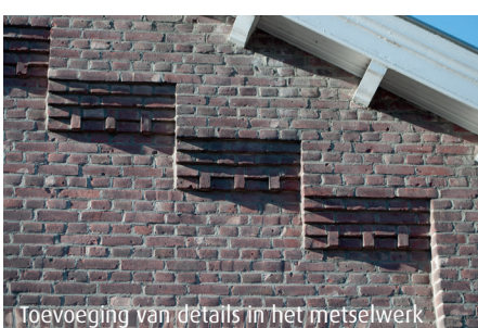
Toevoeging van details in het metselwerk